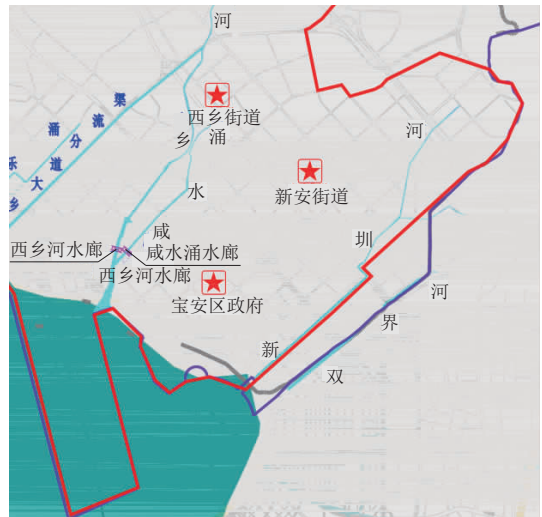
图 1 区域位置图