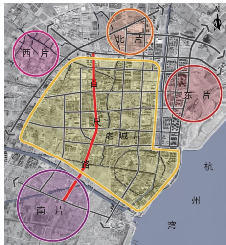
图 1 项目位置图