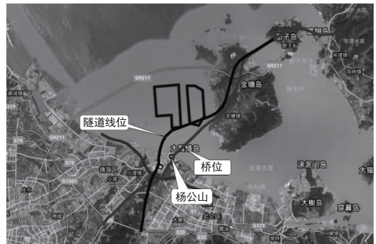
图 1 线位方案示意图

根据经济性、规划协调性、跨海通道建设难度、航道及码头影响、接线政策处理难度等多方面,铁路选取北仑西站(含)–西堠门桥头(路线长度约 26 km),公路选取好思房互通至西堠门大桥桥头(路线长度约 28 km)进行比选: