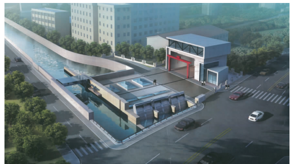
图 1 虹口港泵闸工程效果图

一遇高潮位 6.00 m。本工程主要施工内容包括:(1)在虹口港东大名路南侧新建泵闸;(2)拆除原虹口港老闸并按河道规划新建老闸址处防汛墙;(3)新建泵闸管理区;(4)原东大名路老桥拆除重建,桥梁跨度 16 m+9.8 m,宽 28 m;(5)DN1400 的供水管在重建的东大名路桥梁桩间采用倒虹管穿越河道;(6)工程范围上下游河段拉森钢板桩围堰修筑与拆除;(7)施工期间,在东大名路桥上游搭设一座人行钢便桥,工程完成后拆除该钢便桥。